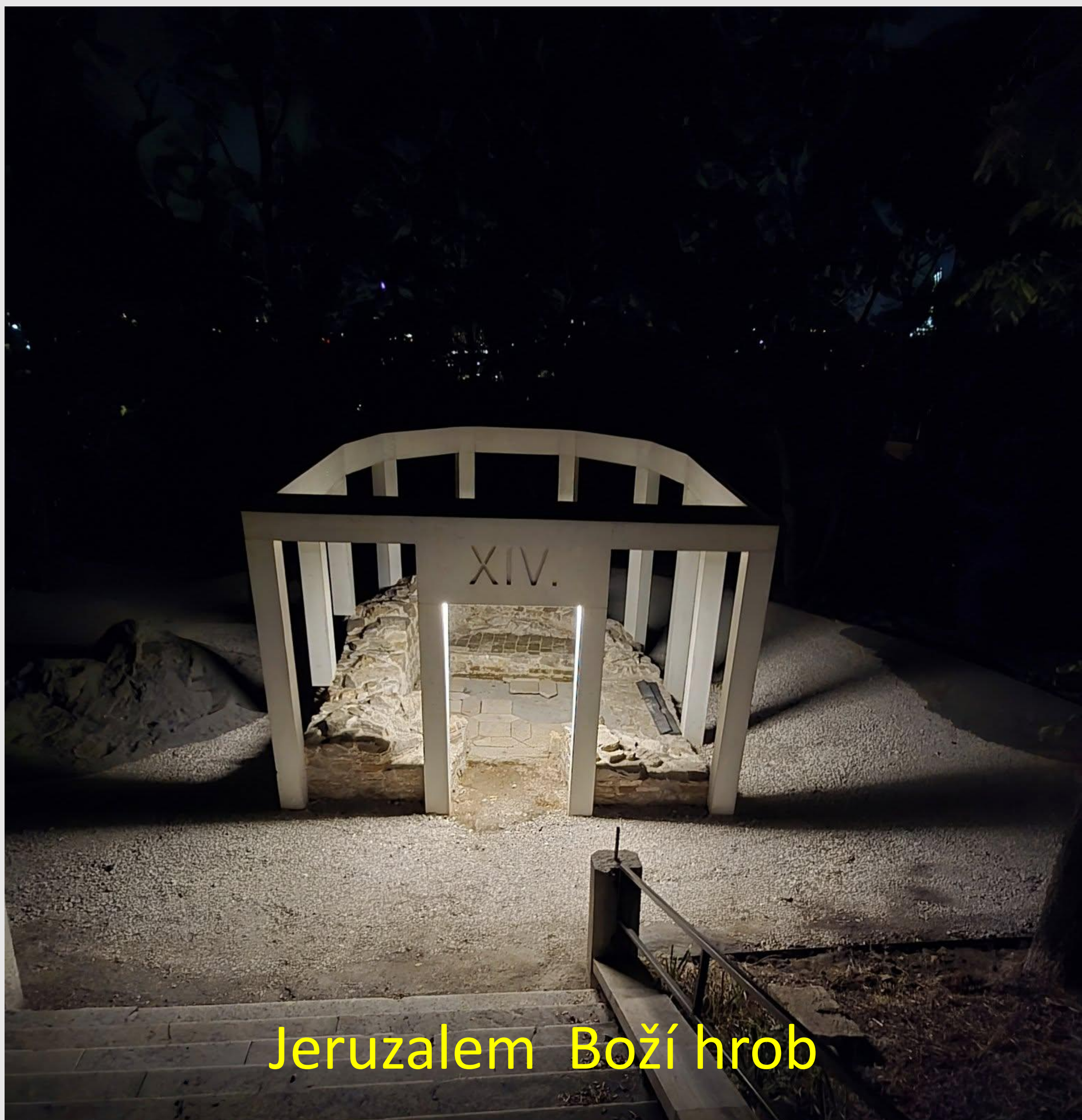
Jeruzalem Boží hrob